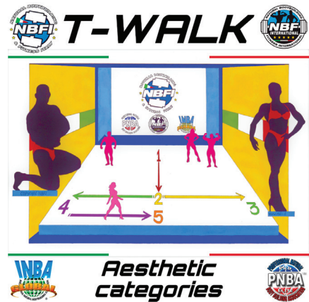
VISTA DALLA GIURIA E DAL PUBBLICO