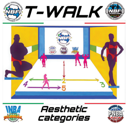
VISTA DALLA GIURIA E DAL PUBBLICO